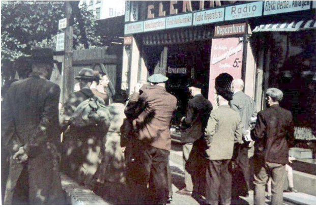
Reichshauptstadt Berlin am 19.1939: "Seit 5:45 Uhr wird jetzt zurückgeschossen!" Berliner verfolgen vor einem Elektrogeschäft die Radioübertragung von Hitlers Rede über den Ausbruch des Krieges mit Polen.

Menschen bei ihren Familien sein konnten. Der Führer wandte sich an die Nation und sagte, Polen habe sich unnachgiebig geweigert, mit dem Reich zusammenzuarbeiten, um die Korridorprobleme zu lösen. Ich wusste, dass Deutsche in Polen vertrieben und gezwungen worden waren, ihr gesamtes Hab und Gut aufzugeben und Gerüchte besagten, dass einige von ihnen getötet wurden. Mein Vater sprach oft davon.