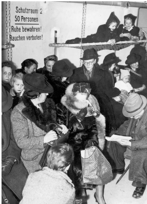
Alltag in der zweiten Hälfte der Zweiten Weltkriegs: Einwohner Berlins 1943 während eines Luftangriffs in einem öffentlichen Luftschutzbunker.

konnten jederzeit losgehen, denn man wollte uns rechtzeitig warnen, damit wir Schutz suchen konnten. Viele waren darüber verärgert und beschwerten sich. Ich hörte sie jedes Mal, wenn wir in die Schutzräume geschickt wurden und keine Bombe fiel.