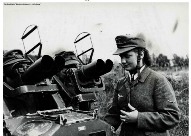
Lufttraumbeobachter und eine Luftwaffen Helferin, die die Koordinaten der einfliegenden Feindmaschinen an die Flugabwehrstellungen weitergibt.

Ich wurde als Zeichnerin ausgebildet, um die Flugzeugbesatzungen über die Position der feindlichen Bomber zu informieren. Diese Arbeit war sehr erfüllend, da ich das Gefühl hatte, mich auf meine Weise gegen die Terroristen wehren zu können. Ich glaubte, dass jeder Bomber, den ich abzuschießen half, deutsche Frauen und Kinder rettete. Ich bekam jedoch ein trauriges Bild vom Zustand unserer Verteidigung; unsere Luftwaffe war zahlenmäßig unterlegen und nun mit unerfahrenen Piloten besetzt, die leichte Beute waren. Ich hörte einen Offizier sagen, dass unsere Männer in der Luft 30 zu 1 in der Unterzahl waren.