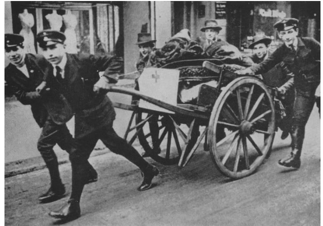
Berliner Schüler sammeln Wolle und Altmittel, 1915