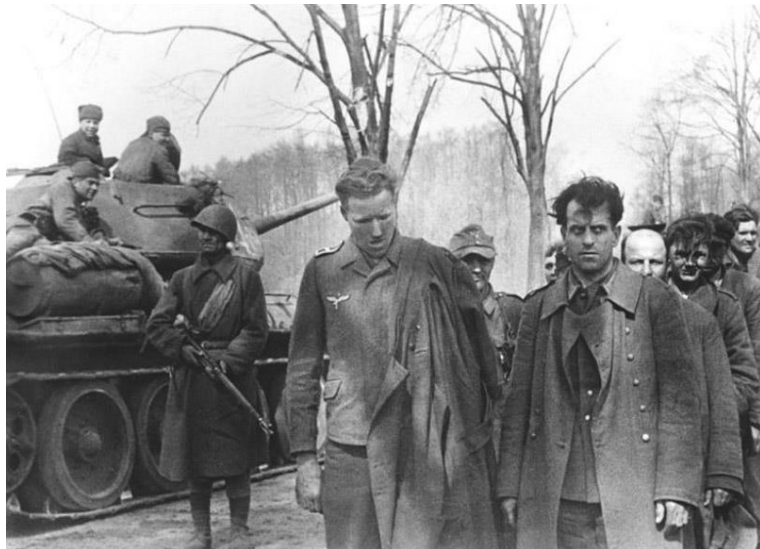
Geschlagen und verängstigt marschieren junge Männer in Europa auf einem Panzer an spöttischen Kommunisten vorbei. Eine beliebte Taktik der Alliierten war es, die Hoden und Genitalien ihrer Gefangenen zu zerquetschen. Millionen von Deutschen und ihren Partnern von den Achsenmächten