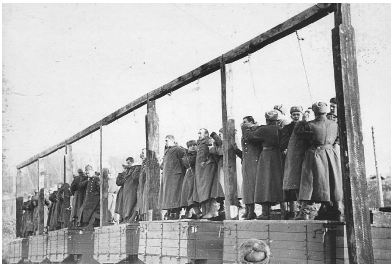
Deutsche Kriegsgefangene werden von den Sowjets in Massen hingerichtet