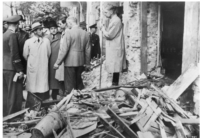
Nach dem ersten britischen Bombenangriff auf Berlin am 24. August 1940 begutachtet der deutsche Propagandaminister Joseph Goebbels (mit weißem Hut und Mantel) einige der kleineren Schäden.