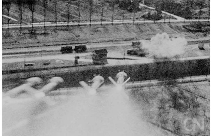
Vor Tieffliegern gibt es kaum Deckung Raketenangriff eines britischen Typhoon-Jagdbombers auf eine Bahnanlage aus der Perspektive der Bordkamera, angeblich aufgenommen Anfang 1945 im Raum Nordhorn.

Auf dem Rückzug herrschte Chaos, Autos blieben liegen und verstopften die Straße und Flugzeuge beschossen die Kolonnen, in denen sich weder Militärfahrzeuge noch Personal befanden. Ich fuhr in einem mit Holz befeuerten Auto, das wie ein Kaminofen und ich erinnere mich an die Warnungen, dass man sterben könnte, wenn die Dämpfe zu stark würden. Es dauerte eine Woche, um eine Stadt zu erreichen, die eigentlich nur ein paar Stunden entfernt sein sollte. Die Brücken waren kaputt und die Straßen zu verstopft. Wir mussten im Auto schlafen und das Essen war knapp. Eine SS-Einheit einer ausländischen Division bot uns Lebensmittel an und zeigte unserem Fahrer einen Weg, der ohne Brücken auskam - sie waren sehr freundlich.