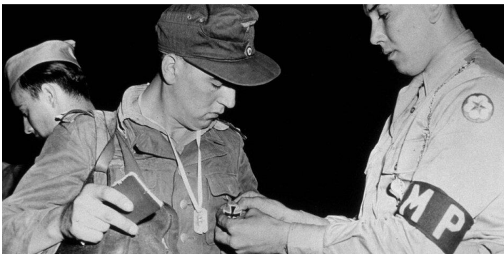
Ein amerikanischer Militärpolizist nimmt das Eiserne Kreuz vom Hemd eines deutschen Gefangenen ab.

Sie hatten ihr eigenes Krankenhaus, Schulen und Geschäfte, die unbehelligt waren. In der Nähe des Kaufhauses befand sich eine Anwaltskanzlei, die jüdisch war, da sie Israel in ihrem Namen führen mussten und so erkannte ich viele jüdische Geschäfte. Das zeigt, dass nicht alle Juden uns feindlich gesinnt waren und wir ließen sie in Ruhe.